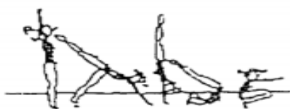
Apoio facial invertido, rolamento à frente (20%)

Construa uma sequência, com as diversas figuras, de forma a obter no mínimo 60% de média do valor global dos elementos técnicos.